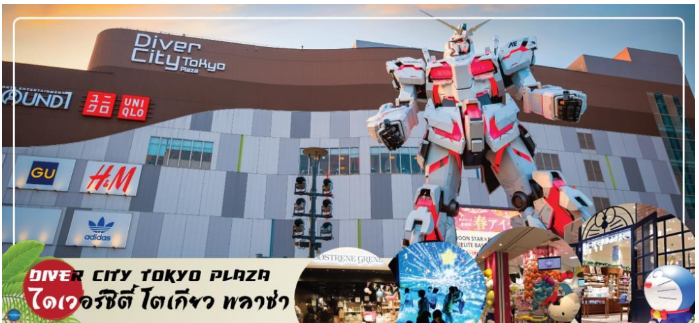
DIVER CITY TOKYO PLAZA ไดเวอร์ซิตี โตเกียว พลาซ่า

เดินทางสู่ ย่านโอไดบะ (Odaiba) เมืองคือเกาะที่สร้างขึ้นไว้เป็นแหล่งช้อปปิ้ง และแหล่งบันเทิงต่างๆ ในอ่าวโตเกียว ได้รับการปรับปรุงให้มีชื่อเสียงและเป็นที่นิยมในช่วงหลังของปี 1990 นอกจากนี้สถาปัตยกรรมที่สวยงามตั้งอยู่มากมายแล้ว แต่ก็ยังคงความเป็นธรรมชาติไว้ด้วยความอุดมสมบูรณ์ของพื้นที่สีเขียว ไดเวอร์ซิตี โตเกียว พลาซ่า (Diver City Tokyo Plaza) เป็นห้างดังอีกห้างหนึ่ง ที่อยู่บนเกาะ โอไดบะ จุดเด่นของห้างนี้ก็คือ หุ่นยนต์กันดั้ม ขนาดเท่าของจริง ซึ่งมีขนาดใหญ่