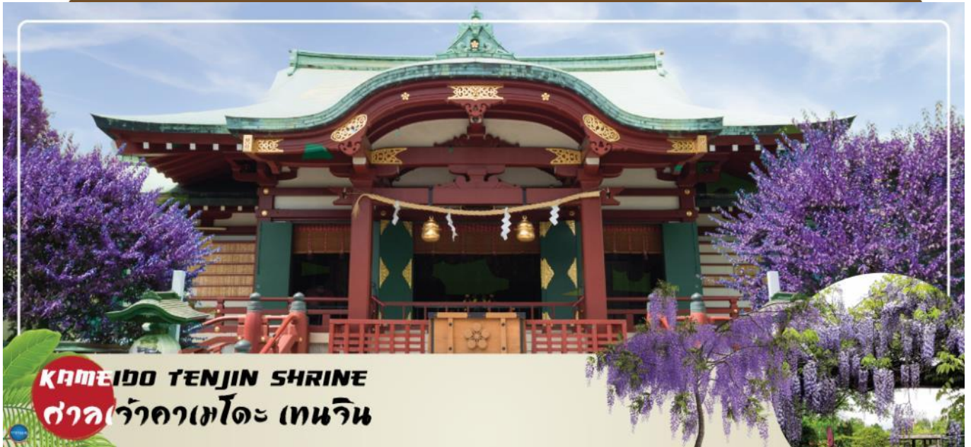
KAMEIDO TENJIN SHRINE ศาลเจ้าคาเมโตะ เทนจิน